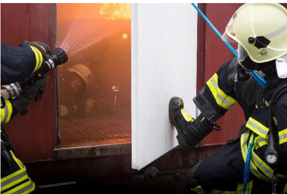
Fire Awareness Training